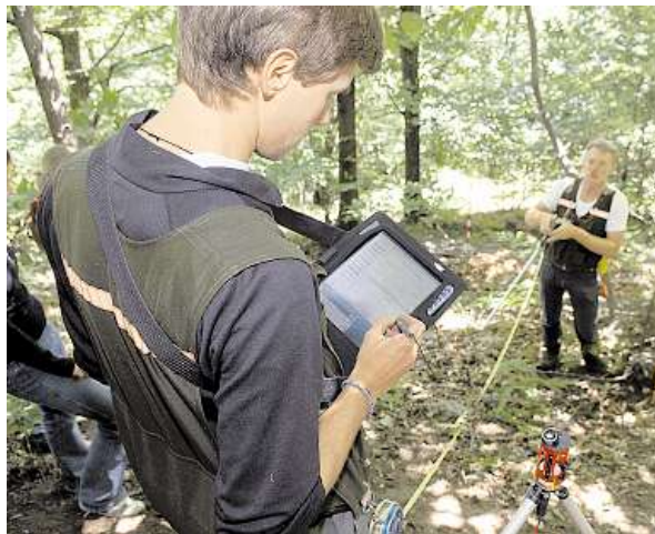
STRUMENTI tradizionali e moderni per catalogare il bosco in ogni suo dettaglio.

magazzinati nella memoria dei computer portatili di cui sono dotati i collaboratori dello WSL. Confrontati con quelli dei due precedenti (eseguiti a metà anni Ottanta ed a metà anni Novanta), forniranno indicazioni sui cambiamenti dell'area forestale, sulla composizione delle specie presenti, sull'utilizzazione del bosco quale area di svago e sullo sfruttamento del legname. Quest'ultimo aspetto, assieme a quello relativo alla funzione protettiva del bosco, interessa particolarmente l'autorità politica ticinese. «Oggi - ha rilevato Marcello Bernardi , capo della Divisione ambiente del Dipartimento del territorio - è sfruttato solamente il 10% della massa legnosa potenzialmente disponibile. Per incentivare l'uso di legname quale fonte energetica in alternativa al petrolio