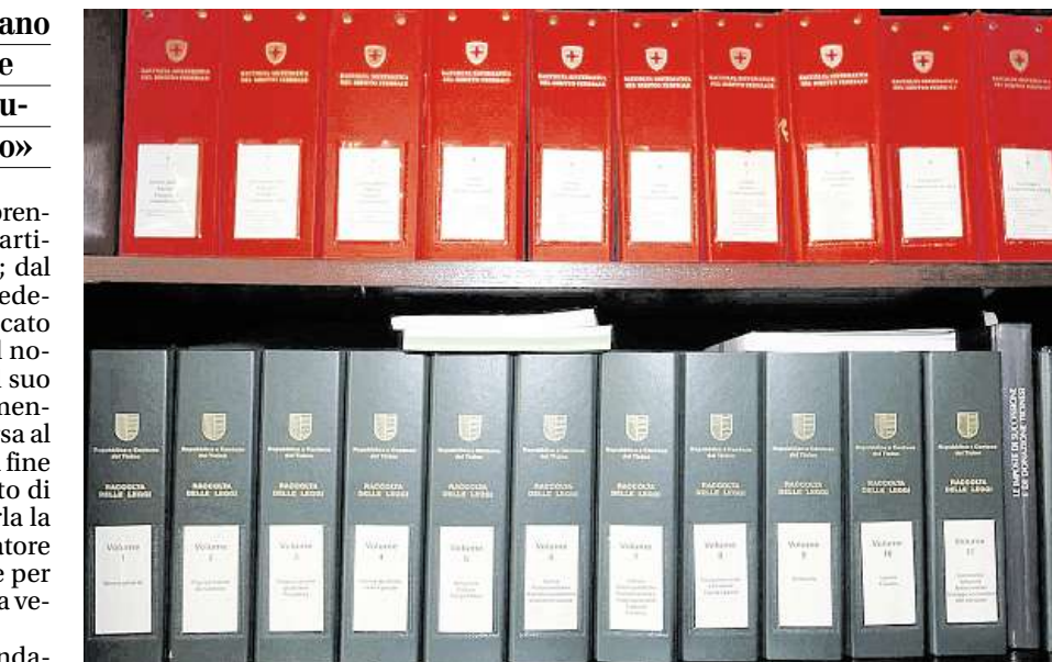
LE LEGGI DEL PAESE Esistono e regolano la convivenza civile. Far sì che siano rispettate è compito delle Autorità, ma anche dei cittadini.