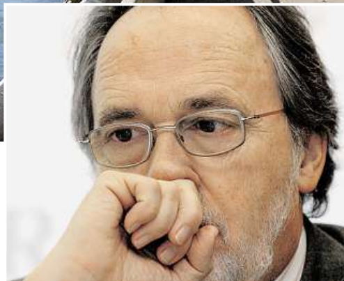
SISTEMA INIQUO Il senatore Dick Marty (a sinistra) non usa mezzi termini denunciando le «black list» del Consiglio di sicurezza nell'Onu (sopra: la sede a New York). «Il sistema delle black list è iniquo e inciampa in interessi che poco hanno a che vedere con i diritti dei singoli cittadini.